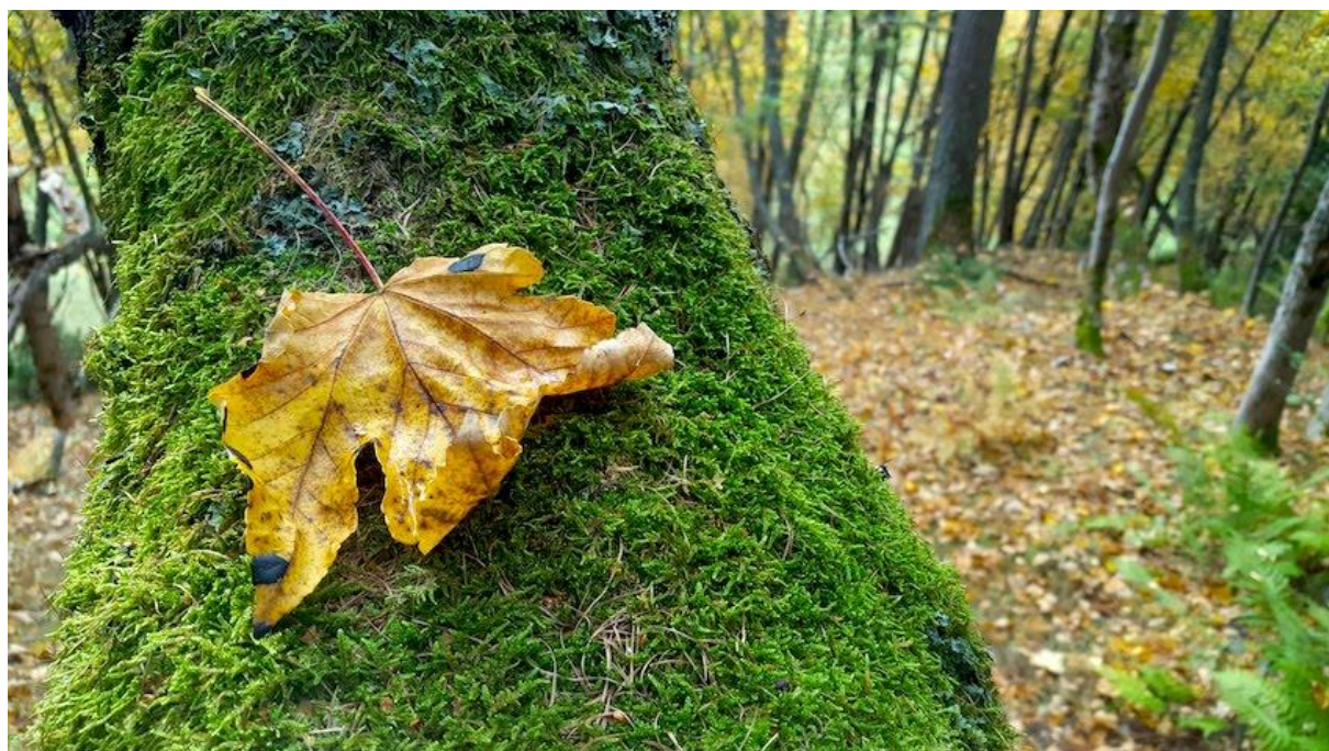
Haut-omne en couleurs

Murmure d'automne. Les saisons sont climatiques autant qu'intérieures. Nous récoltons aujourd'hui les fruits d'une année d'action et d'abondance, mais déjà murmure l'hiver en nous et autour de nous. Une rafale de vent et l'arbre accepte de se dépouiller de ses feuilles pour en bâtir de nouvelles, plus tard, quand il sera temps. La chlorophylle, protéine omniprésente, prend le chemin des racines, réserve pour le renouveau du printemps. En effaçant son « vert-nis », la feuille ne change pas de couleur, elle révèle celles qui étaient déjà là – jaune, rouge, marron-, rendues discrètes par la chlorophylle. Comme une transformation intérieure qui ne demanderait pas d'inventer mais de révéler, comme se débarrasser d'une couche à laquelle on est attaché.e, précieuse, l'imprimer dans nos racines pour laisser nos autres couleurs s'exprimer. L'automne est un temps de retour vers soi, pour ancrer le précieux et composter le superflu, l'encombrant. L'automne murmure la discrétion, le repos, mais aussi la vie déjà à venir d'un printemps prochain. Immersion Montagne vous souhaite un très bel automne et vous accompagne cet hiver dans les racines de l'arbre, dans le mouvement de nos couleurs sur la neige blanche.